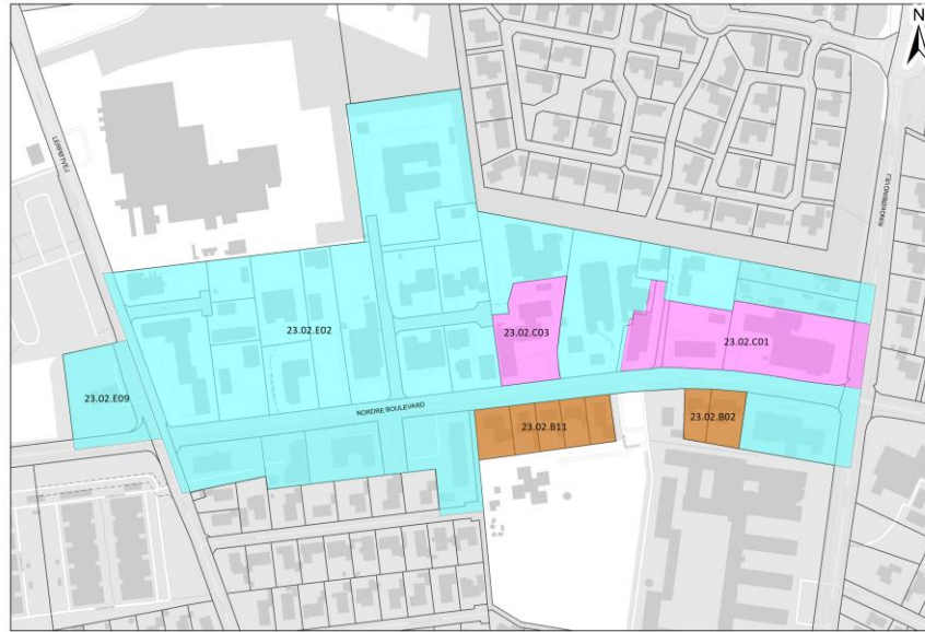
Figur 1 Eksisterende kommuneplanrammer